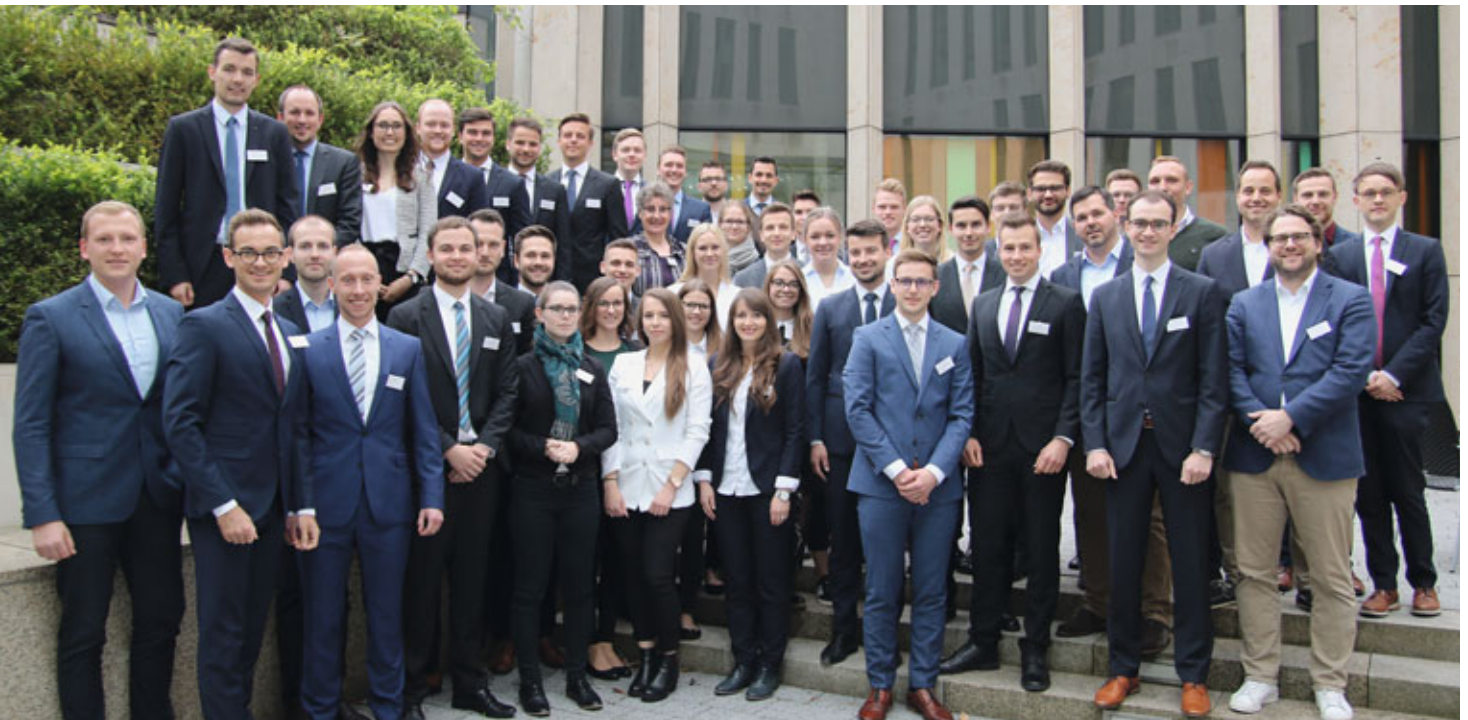
Erlebten ein spannendes und abwechslungsreiches Programm: Die rund 60 Teilnehmer der Sommerakademie.